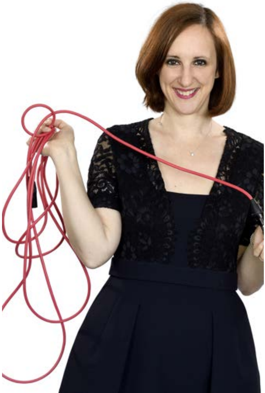
Émilie Munera