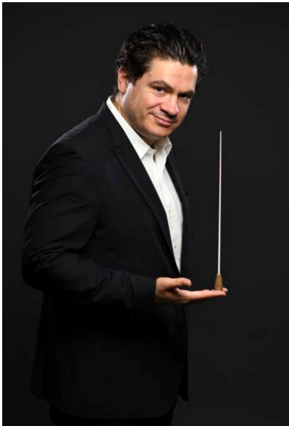
Cristian Măcelaru, directeur musical de l'Orchestre National de France