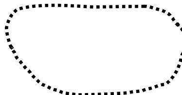
Le pays des musiciens instrumentistes solistes